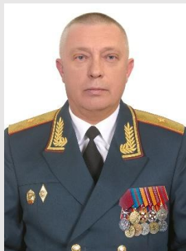
Начальник Московского высшего общевойсковое командного училища генерал-майор БИНЮКОВ Роман Александрович

В стенах Московского высшего общевойскового командного училища получили образование 5 маршалов и более 600 генералов. За годы существования учебного заведения 92 выпускника стали Героями Советского Союза,